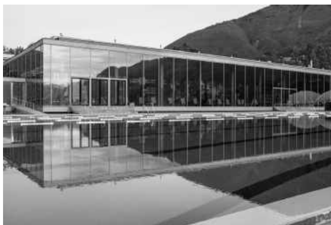
Casa Anatta Monte Verità, Ascona