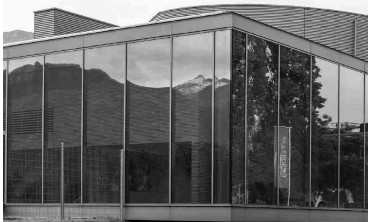
Termali e Salini Locarno