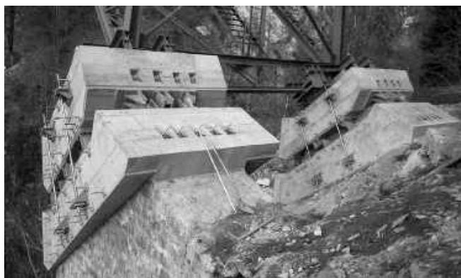
Galleria Bavorca Lavizzara Ponte Ruinacci Camedo